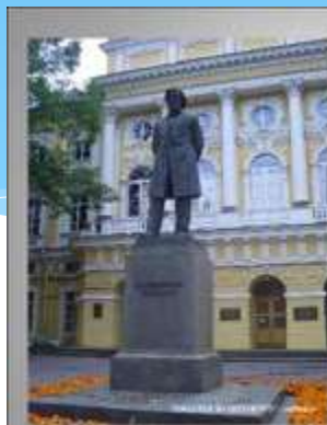
Памятник К. Д. Ушинскому во дворе РГПУ им. А. И. Герцена в Санкт-Петербурге

«Педагогика - это не наука, а искусство».